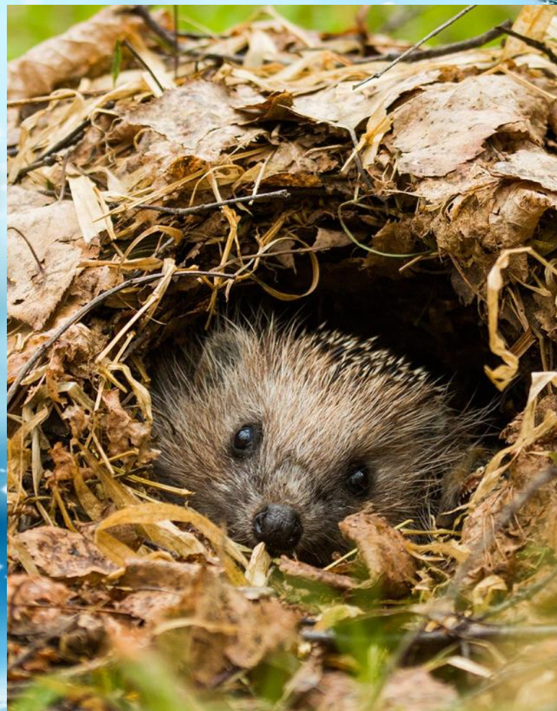
Ежик в домике