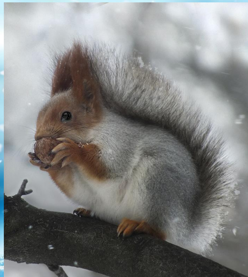
Белочка летом и зимой